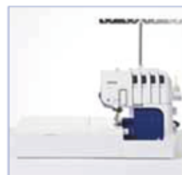
Área de brazo libre Área braço livre