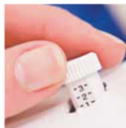
Control de presión Controlo da pressão