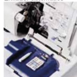
Almacén de accesorios Armazenamento de acessórios