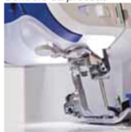
Área de trabajo con luz Área de trabalho com luz