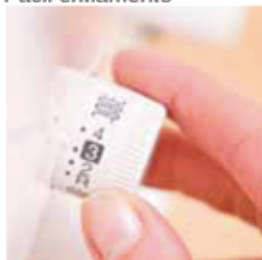
Longitud de puntada Comprimento do ponto