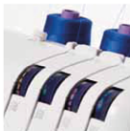
Fácil enhebrado Fácil enfiamento