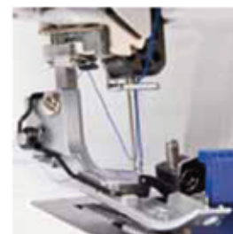
Enhebrador automático Enfiador automático